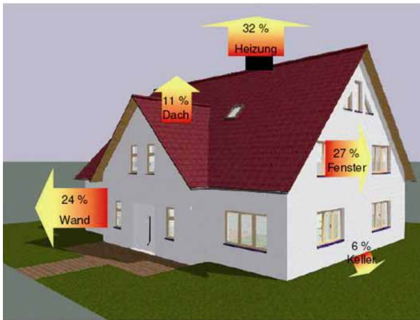
Grafik : Energieverluste am Gebäude

Wie in der Grafik zu sehen ist, stellt z.B. die Hausfassade die größte Fläche der momentanen Energieverluste dar. Das bedeutet, dass hier durch geeignete Maßnahmen die meisten Heizkosten eingespart werden können.